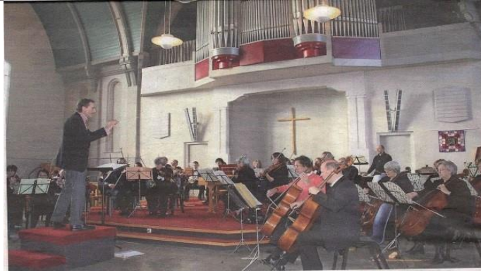
Koren en orkesten treden graag op in Het Kruispunt, zoals op de foto Sinfonietta Voorschoten.

De hoop van de protestante gemeente en potentiële koper Bakker is gericht op de politiek. Die besprekt de eisen van B en W op de ja-