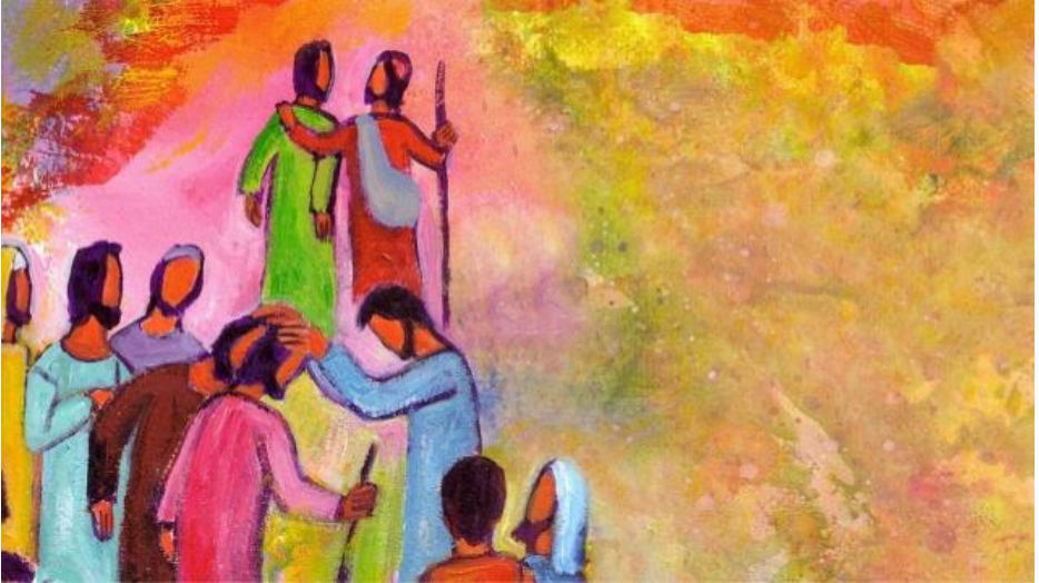
Twee aan twee de wereld in