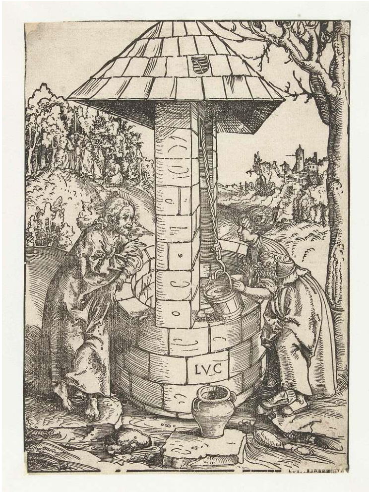
Jezus en de Samaritaanse vrouw