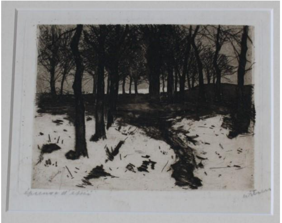
Ets van Willem Witsen

'Kijk, in de donkre horizon achter de bomen wordt het licht.'