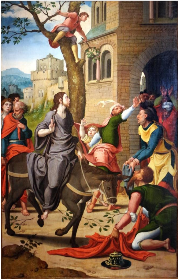
Intocht van Jezus in Jeruzalem Pieter Coecke van Aelst (1502-1550)