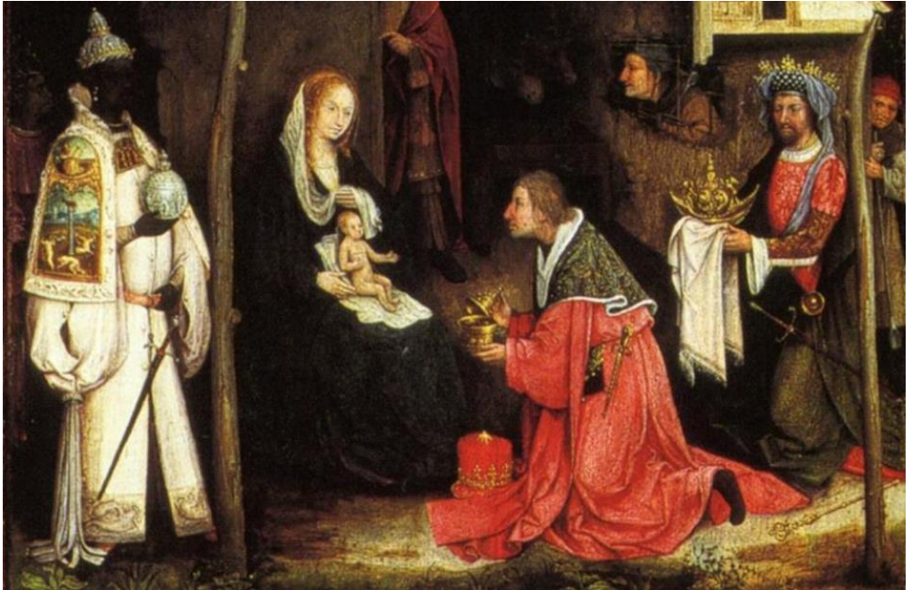
Detail uit het drieluk 'De aanbidding der magiërs' (Anderlecht) uit de school van Jeroen Bosch uit circa 1500 – 1540.

Voor het nieuwe jaar wensen we u 'vrede en alle goeds'.