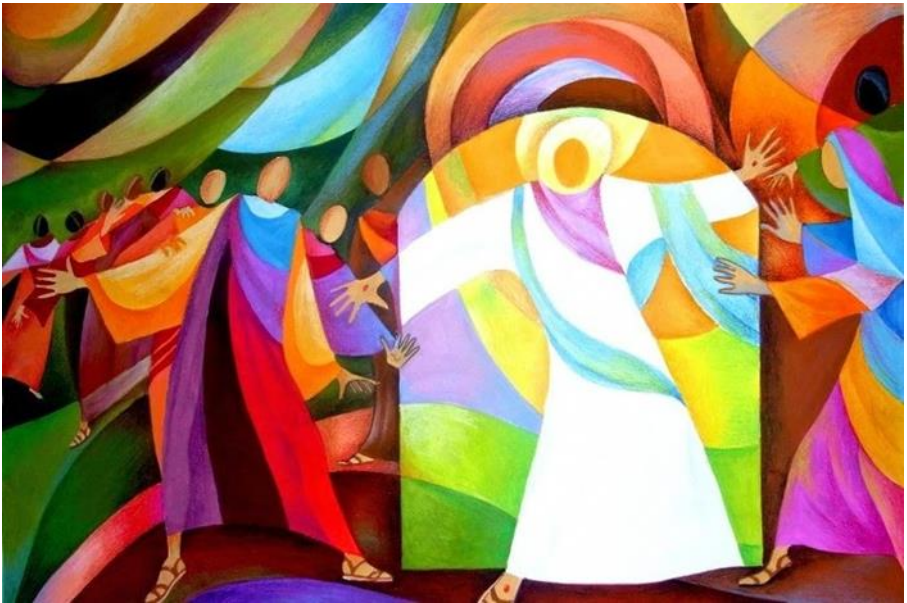
'Verschijning aan de leerlingen' Ed de Guzman

'Sta op, laat liefde groeien en bloeien'