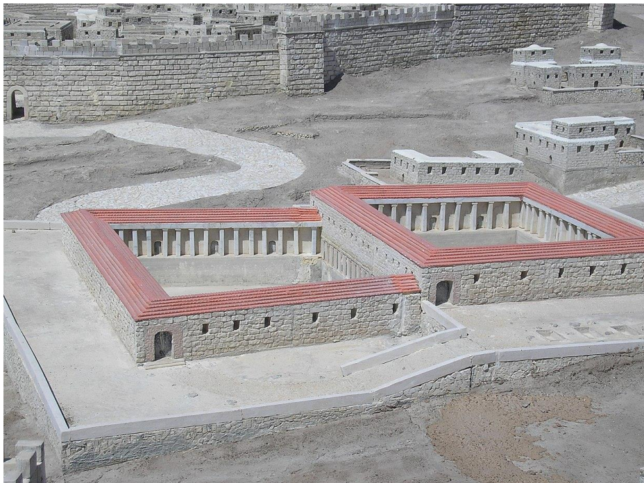
Schaalmodel van het dubbele bad van Betzata