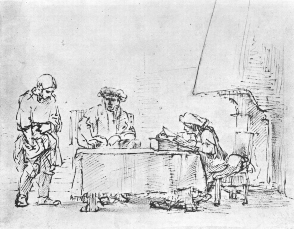
Rembrandt – 'De gelijkenis van de talenten'