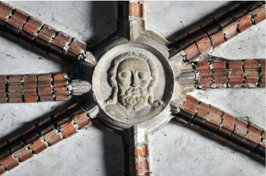
Afbeelding oude sluitsteen.