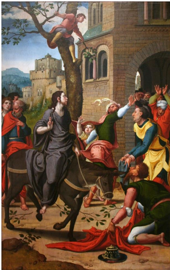
Intocht van Jezus in Jeruzalem Pieter Coecke van Aelst (1502-1550)