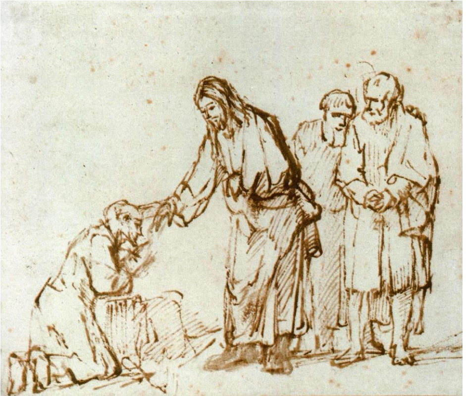
Rembrandt, Genezing van een melaatse