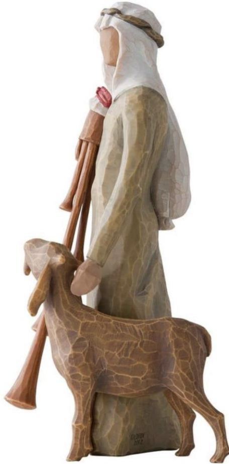
Herder van hoop