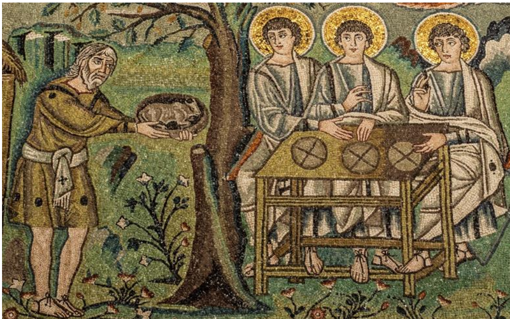
De gastvrijheid van Abraham – Mozaïek in de Basiliek van San Vitale in Ravenna