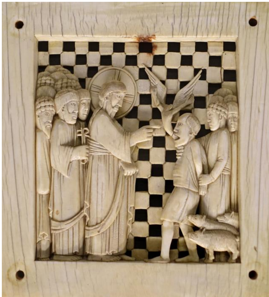
Genezing van een bezeten man Ivoor uit de kathedraal van Maagdenburg, 968