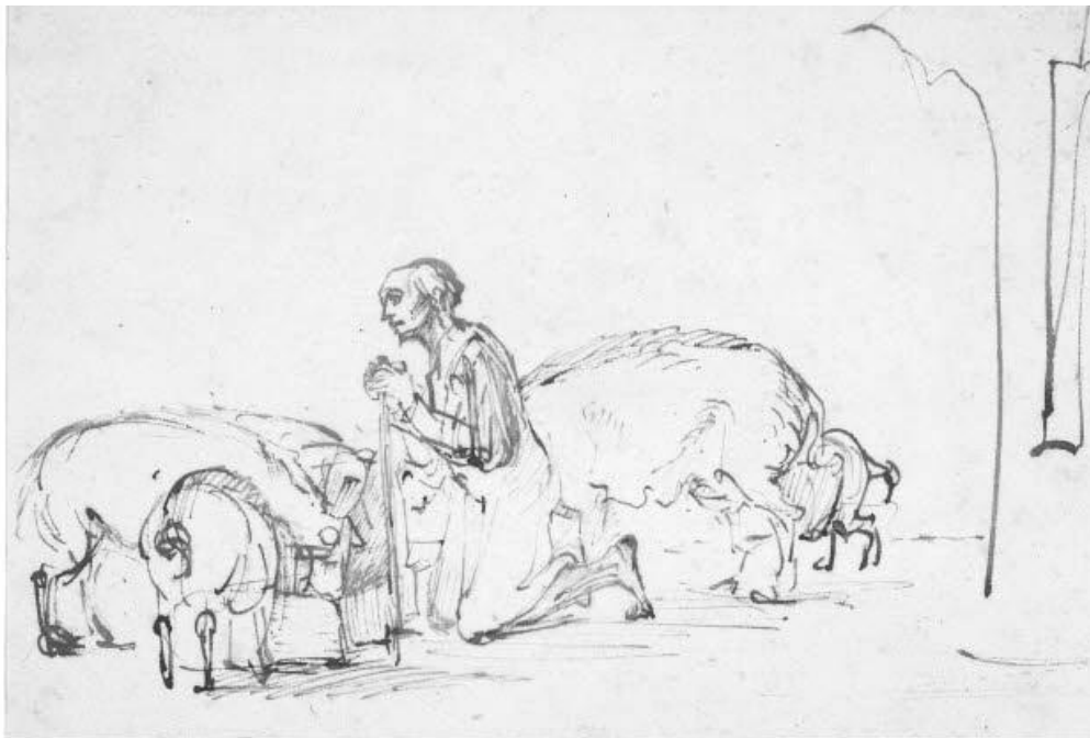
De verloren zoon als varkenshoeder Pentekening, Rembrandt