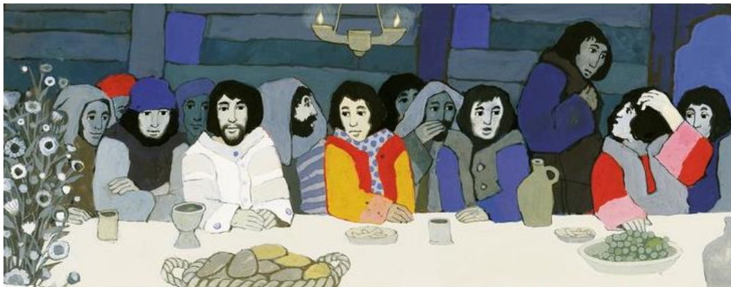
‘Het laatste avondmaal’ – Kees de Kort